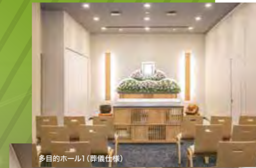
多目的ホール1(葬儀仕様)