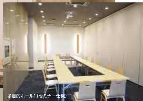
多目的ホール1(セミナー仕様)