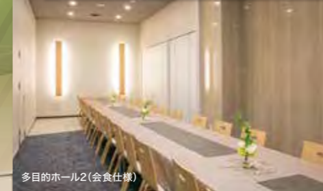
多目的ホール2(会食仕様)