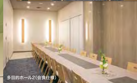
多目的ホール2(会食仕様)