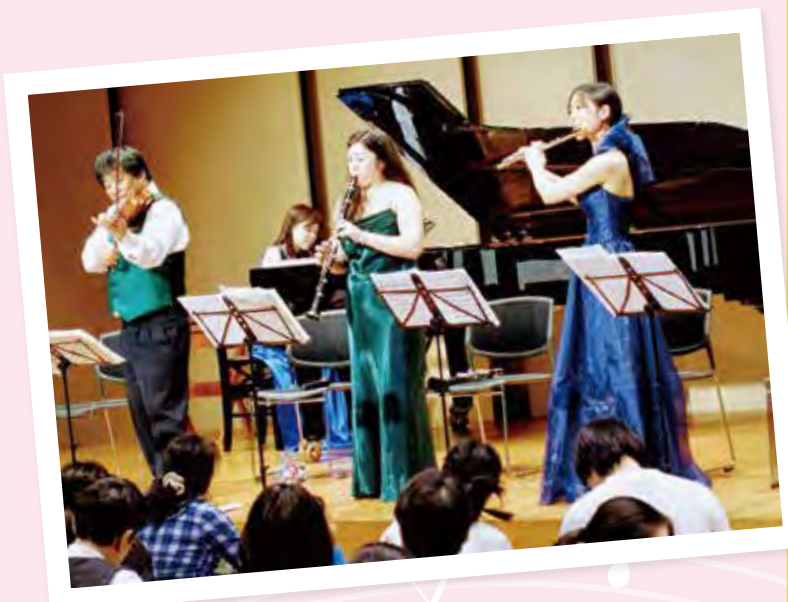
※コンサートイメージ画像

イベント当日にAZUMA clubにご入会頂いた方は、通常入会金1,000円のところ、 [無料] でご入会頂けます! ご入会希望の方は、開場の際に受付致します。 ※新規会員様にも、参加費の無料が適用されます。