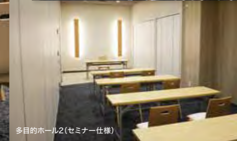
多目的ホール2(セミナー仕様)