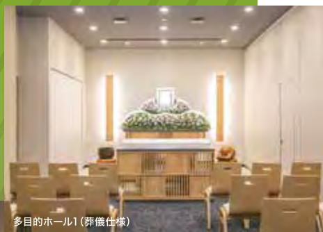
多目的ホール1(葬儀仕様)