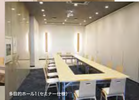
多目的ホール1(セミナー仕様)