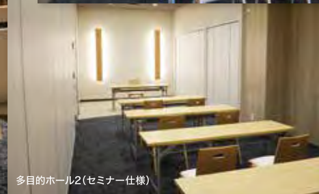
多目的ホール2(セミナー仕様)