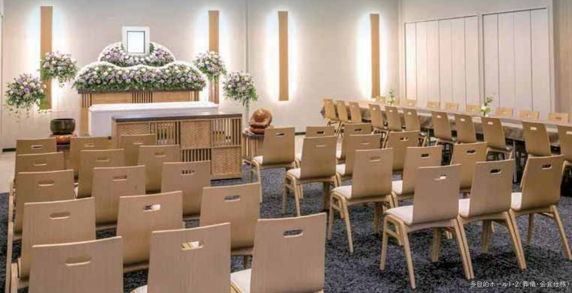
多目的ホール1・2(葬儀・会食仕様)