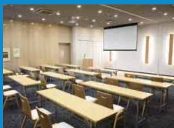
多目的ホール1・2(セミナー仕様)